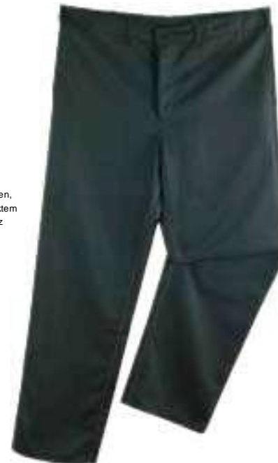
4 nahttaschen, nd verdecktem che, Schlitz