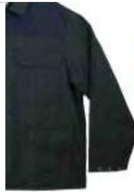
1 Vorder- und Rückenteil