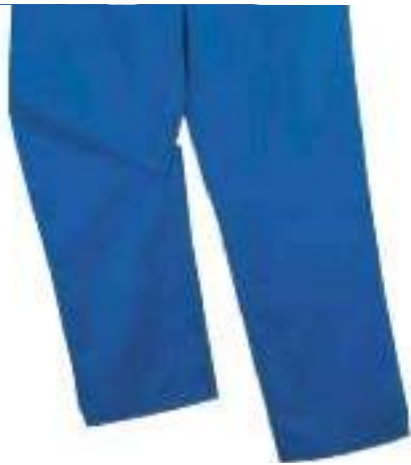
Bundhose: Gesäßtasche mit verdecktem Druckknopf