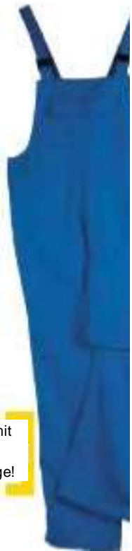
9 Latztasche mit Patte Seitennahttaschen, Gesäßtasche mit Zollstocktasche, Sch Einstieg links mit Kn