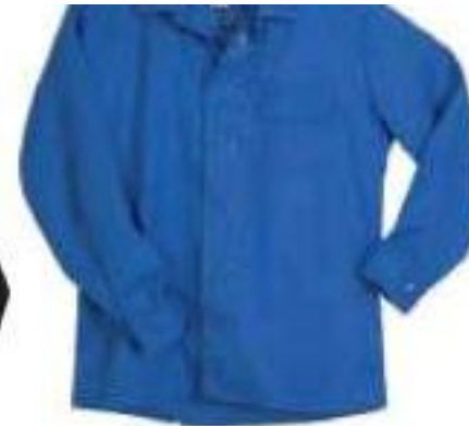
2 Umlegekragen mit angeschnittenem Steg, Verschlussleiste mit Knöpfen, 1 Brusttasche links mit Patte und Knopfverschluss, Armbord mit Knopfverschluss, Rückenlänge: 80 cm bei Artikel-Nr. 223 60703 41 (o. Abb.) und 223 60703 58 (o. Abb.) Steg und Verschlussleiste mit verdecktem Druckknopf